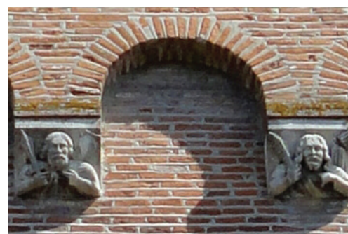
ÉGLISE SAINT-SULPICE, CÔTÉ OUEST