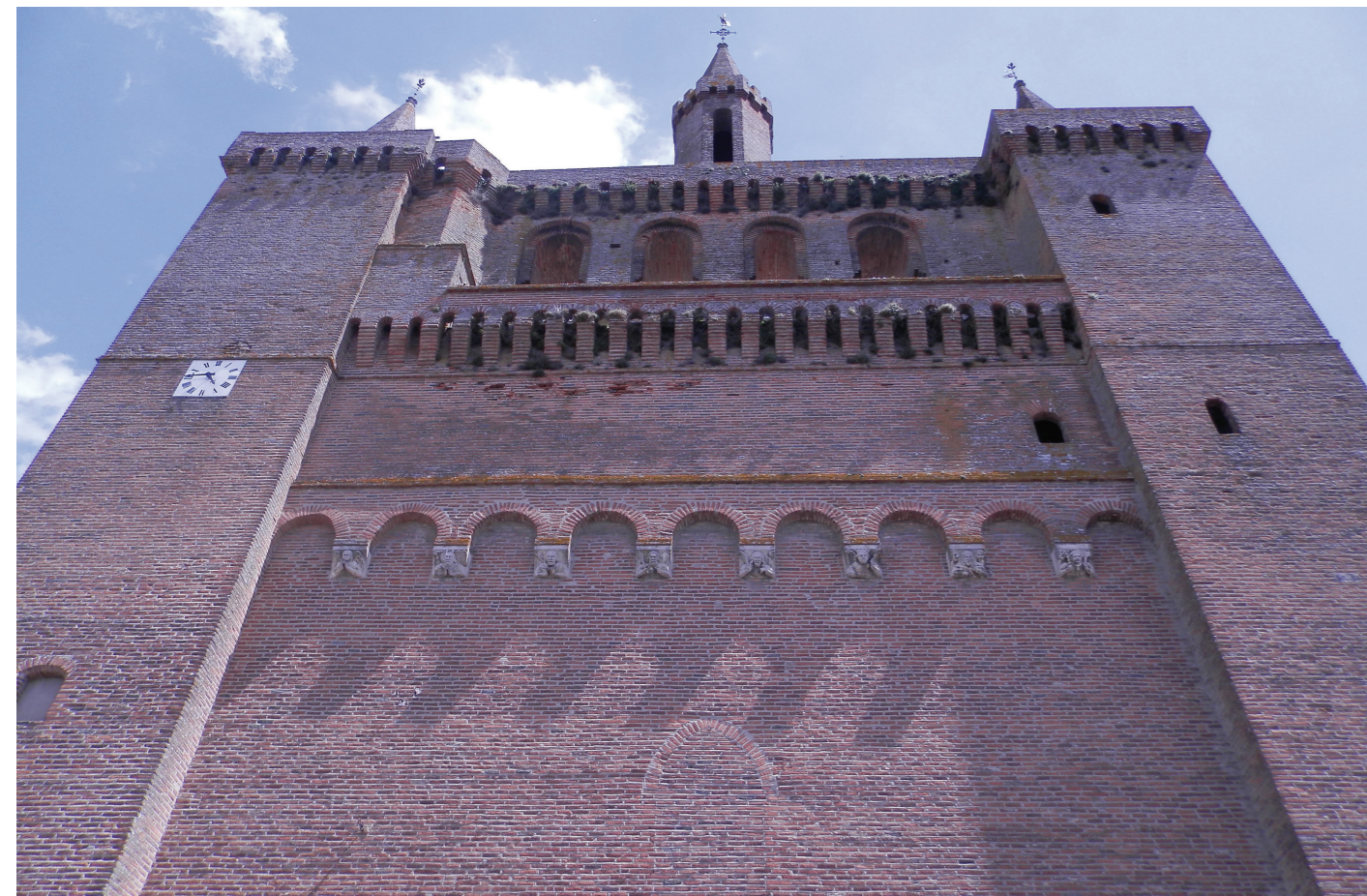
CLOCHER, PARTIE SUPÉRIEURE