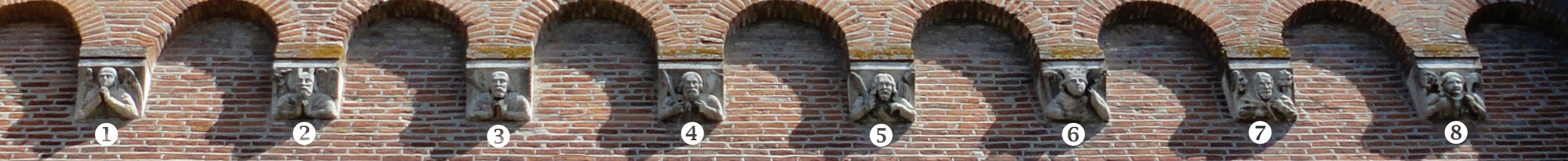
1 ANGE PRIEUR 2 MOÏSE 3 PERSONNAGE NON IDENTIFIÉ 4 JOSUÉ 5 SAMSON 6 DAVID 7 DANIEL 8 ÉVÈQUE MARTYR