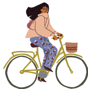
schéma directeur vélo le diagnostic territorial établi

Dans le cadre de son projet de territoire 2020-2030 et de son plan climat air énergie territorial, la Communauté de communes Tarn-Agout a engagé, fin 2022, l'élaboration d'un schéma directeur vélo dont l'ambition est de faire progresser la pratique du vélo au quotidien sur le territoire. Ce travail a débuté par une première phase de diagnostic territorial, conduite sur plusieurs mois. Cette étape a permis de faire émerger les principaux enjeux concernant la pratique du vélo en Tarn-Agout, et servira de base pour proposer et mettre en place des actions concrètes, adaptées aux habitudes et besoins des usagers.