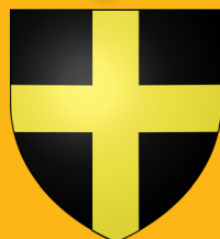
ARMOIRIES* DE BANNIÈRES