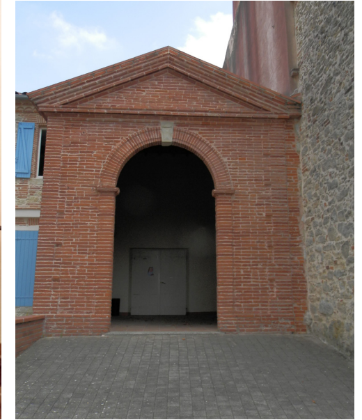
LE PORCHE NÉOCLASSIQUE

Le portail mouluré redevient l'entrée de l'église.