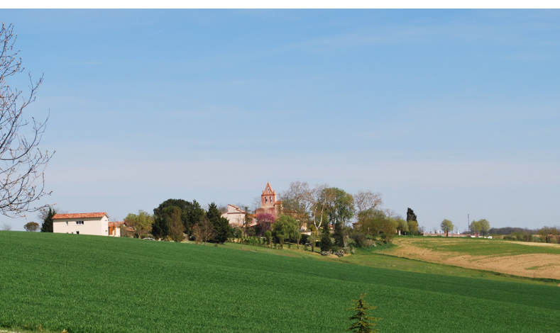
VUE DU VILLAGE, DEPUIS LE SUD-EST

L'église Saint-Jean-Baptiste, présente sur la carte de Cassini de la fin du 18 e siècle est plus ancienne car elle conserve un portail mouluré datant probablement du 16 e siècle.