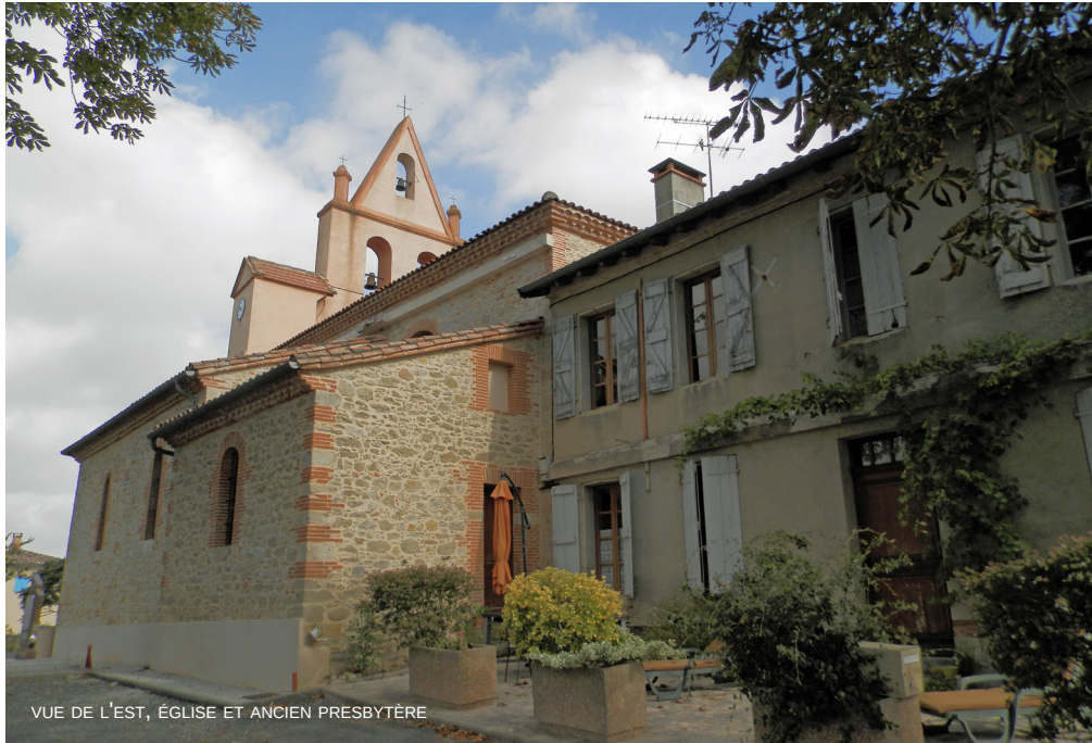
VUE DE L'EST, ÉGLISE ET ANCIEN PRESBYTÈRE

L'église est établie sur un plan allongé composé d'un chevet plat*, d'un clocher-mur*, d'une nef flanquée de chapelles latérales et d'un porche.