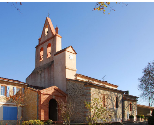
ÉLÉVATION DU SUD DE L'ÉGLISE

L'église Saint-Jean-Baptiste, présente sur la carte de Cassini de la fin du 18 e siècle est plus ancienne car elle conserve un portail mouluré datant probablement du 16 e siècle.