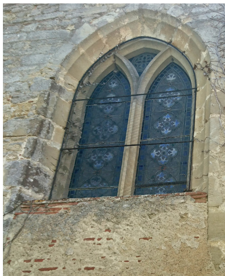
BAIE À MENEAU À DEUX LANCETTES

Enfin, le mur nord de la nef est toujours éclairé par des baies en arc brisé dont certaines ont conservé leur meneau à deux lancettes*.