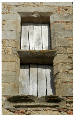
FENÊTRE EN ACCOLADE