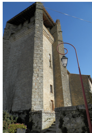
LE CLOCHER, VUE SUD-EST