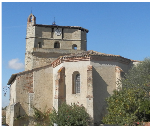
ÉGLISE VUE DE L'EST

Selon les ouvrages du 19 e siècle, l'édifice serait à l'origine une chapelle dépendant du château de Belcastel, détruit à la Révolution. Le clocher-tour* devait permettre la surveillance des ennemis.