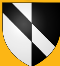
ARMOIRIES* DE BELCASTEL

La commune de 200 habitants s'étend sur 11 km 2 de plaines argileuses et de coteaux argilo-calcaire, irrigués par de nombreux cours d'eau dont la Bernède et la Balerme.