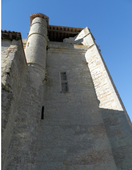
LE CLOCHER, FACE NORD

La partie supérieure est agrémentée d'un encorbellement* à deux ressauts muni de gargouilles formant un chemin de ronde.