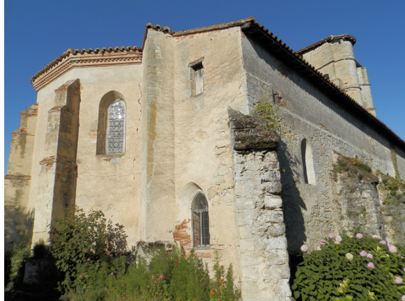
CHEVET ET CHAPELLE NORD