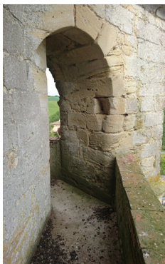
CLOCHER, TOUR DE RONDE