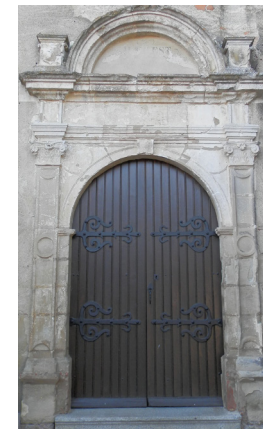
LE PORTAIL RENAISSANCE

La nef renferme une plaque placée dans une chapelle sud dont les inscriptions indiquent qu'une chapelle fut édifée en 1524 et dédiée à Saint-Jean-Baptiste par le prêtre « Ichan Raymond ».