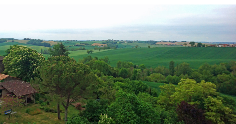
PAYSAGE AU NORD DE LA COMMUNE