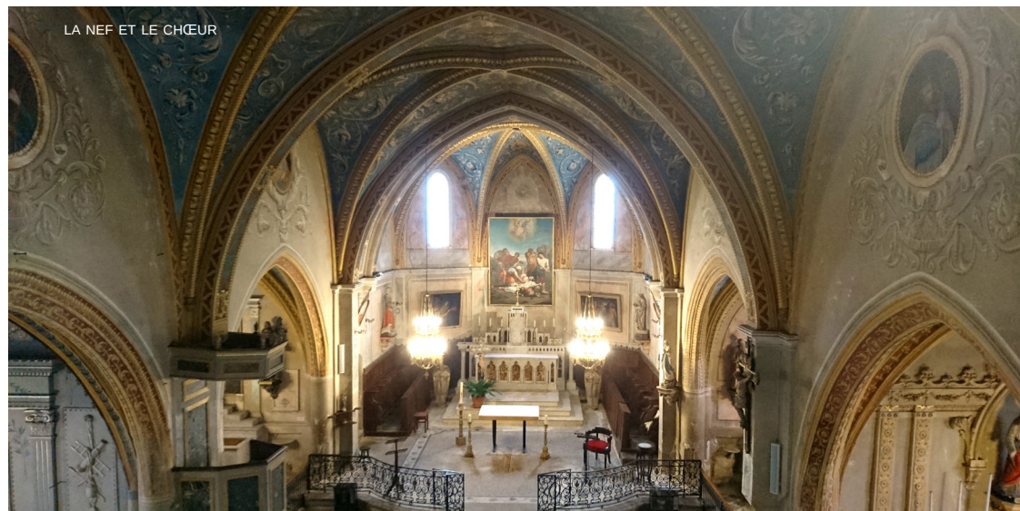
LA NEF ET LE CHŒUR