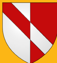
ARMOIRIES* DE MASSAC-SÉRAN