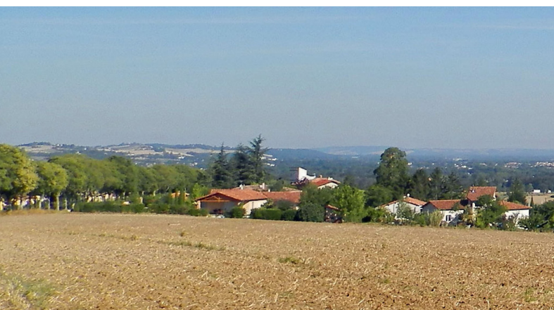
VUE AU NORD DEPUIS LE BOURG

Installé près d'une voie romaine, le village est présent dès le Moyen-Âge mais pourrait avoir des origines plus anciennes.