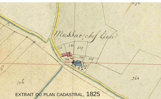
EXTRAIT DU PLAN CADASTRAL, 1825

La commune compte près de 350 habitants et s'étend sur 8,5 km 2 de plaines et coteaux parcourus par des cours d'eau dont les ruisseaux d'En Tournier et de Séran.