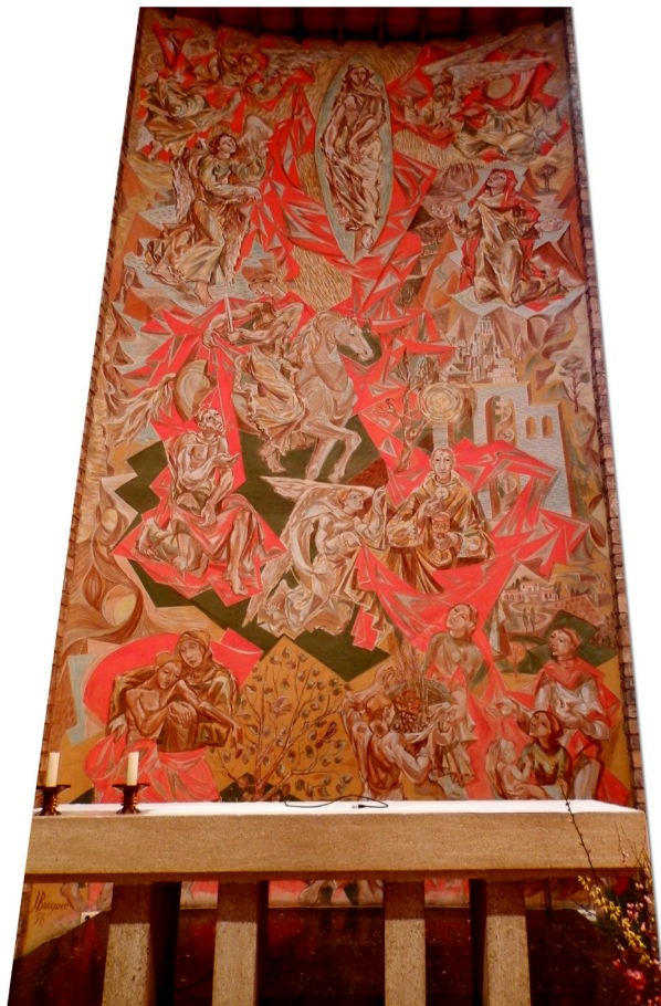
FRESQUE DE SAINT MARTIN