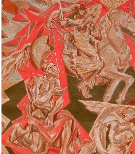
DÉTAIL, DON DU MANTEAU À UN PAUVRE

Le manteau, figuré par un drapé rouge, est omniprésent et relie toutes les scènes de l'œuvre. Il est devenu l'attribut principal de saint Martin et plus généralement, est associé à la vertu de charité.