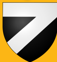
ARMOIRES* DE MONTCABRIER

Au nord des plaines du Lauragais, la commune compte près de 250 habitants et s'étend sur environ 5.5 km 2 de plaines et de coteaux irrigués par de nombreux cours d'eau dont le Nadalou au nord et le Girou à l'est.