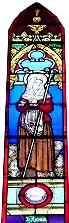
VITRAIL REPRÉSENTANT SAINTE GERMAINE