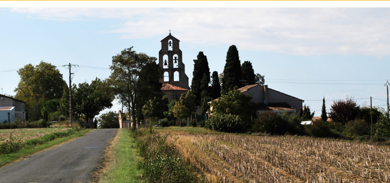
VUE DU VILLAGE, DEPUIS L'EST