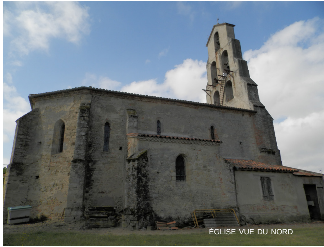
ÉGLISE VUE DU NORD

Le porche abrite un portail mouluré datant probablement du 16 e ou du 17 e siècle.