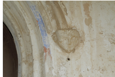
CULOT À TÊTE D'ANGELOT

En arc brisé, le portail est agrémenté de voussures*, auparavant polychromes* (des traces subsistent). La voussure extérieure repose sur des culots* sculptés à tête d'angelot.