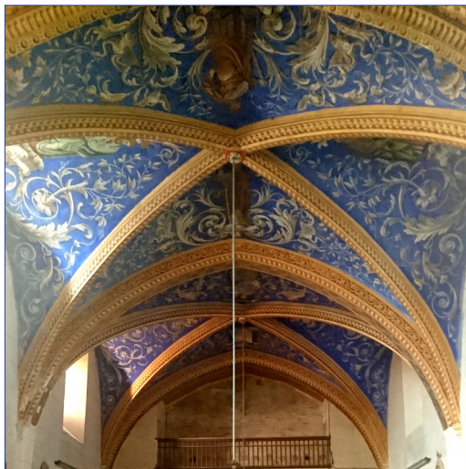
VOÛTE DE LA NEF