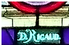
SIGNATURE DU PEINTRE- VERRIER DOMINIQUE RIGAUD