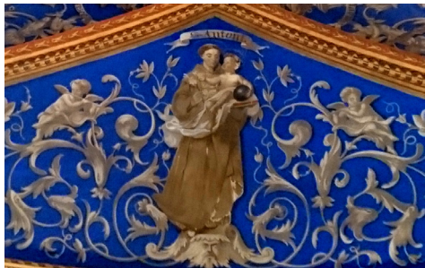
DÉTAIL DE LA VOÛTE

Des voûtes d'ogives couvrent l'intégralité de l'église. Elles sont réalisées en même temps que les vitraux mais elles sont refaites en 1933.