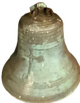
CLOCHE DATÉE DE 1605