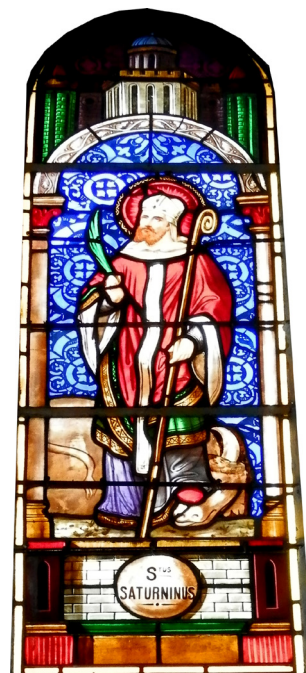
SAINT-SERNIN, NON SIGNÉ, VERS 1860

Les derniers grands travaux de l'église concernent les voûtes d'arêtes* qui seraient peintes entre 1889 et 1904 par l'abbé Ricardou.