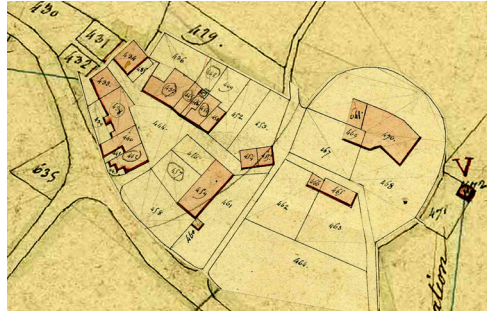
VILLAGE VIEUX (ANCIEN BOURG), EXTRAIT DU PLAN CADASTRAL, 1825

La volonté de développer un bourg central est clairement affirmée et se retrouve dans d'autres communes voisines au 19 e siècle.