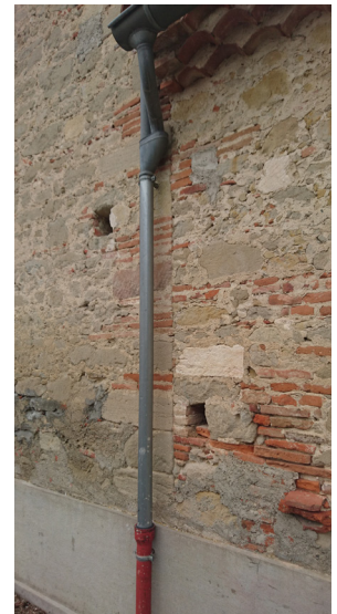
JONCTION ENTRE LA SACRISTIE ET LA NEF