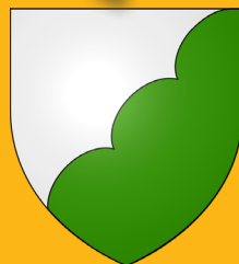
ARMOIRIES* DE VILLENEUVE-LÈS-LAVAU

La commune compte près de 150 habitants et s'étend sur 6 km 2 de plaines et de coteaux, irrigués par de nombreux cours d'eau dont le Girou et le Messal.