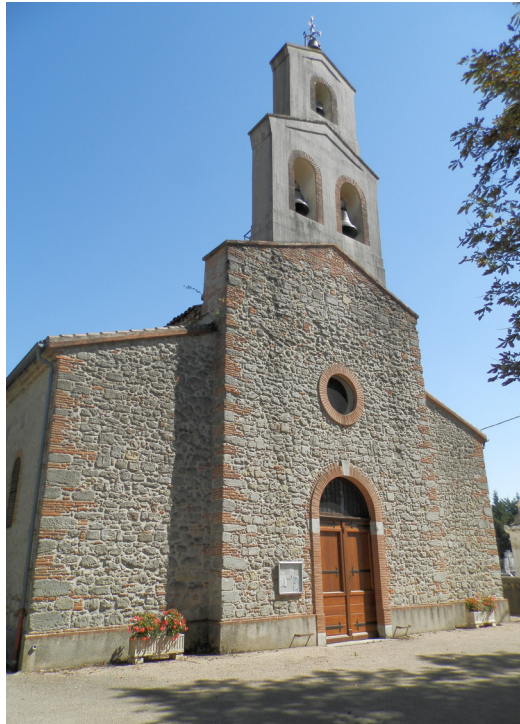
ÉGLISE SAINT-SERNIN ET SAINT-EUTROPE