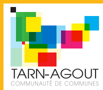
TARN-AGOUT COMMUNAUTÉ DE COMMUNES

La commune compte près de 150 habitants et s'étend sur 6 km 2 de plaines et de coteaux, irrigués par de nombreux cours d'eau dont le Girou et le Messal.