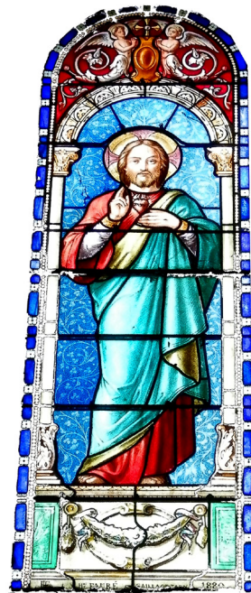
SAINT-SAUVEUR, HENRI FAURÉ, 1880