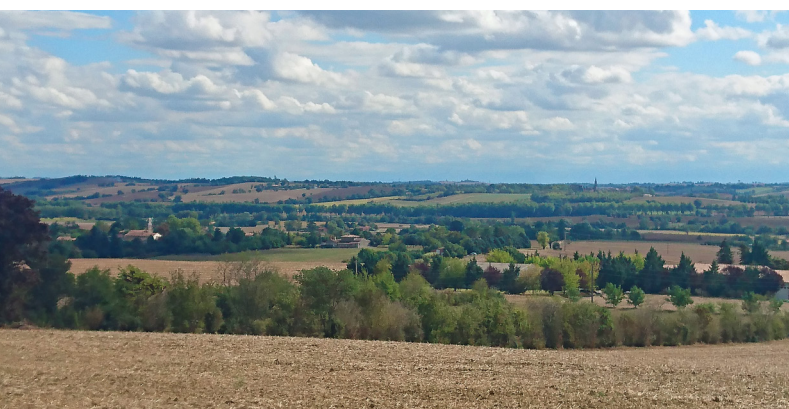
VUE DEPUIS LE NORD DE LA COMMUNE