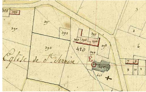
SAINT-SERNIN DE VIDILHAC (BOURG ACTUEL), EXTRAIT DU PLAN CADASTRAL, 1825