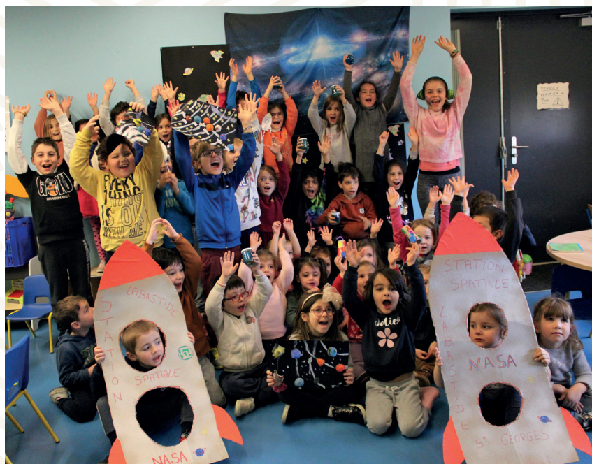
Voyage dans l'espace pour les trois accueils de loisirs sans hébergement