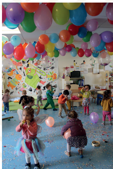
Carnaval dans les structures Petite enfance