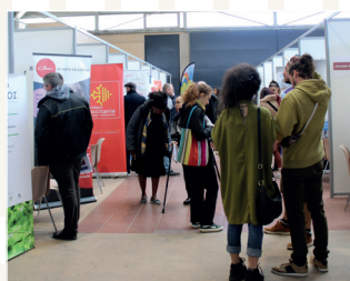
Matinale de l'emploi à Lavaur