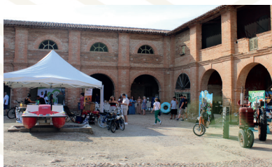
Marché de commerçants délocalisé à Azas