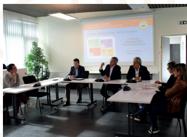
Lancement de la carte cadeau locale « Ici ici, es aqui » en Tarn-Agout