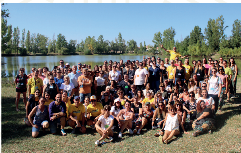
Journée de cohésion des agents de la Communauté de communes Tarn-Agout à Ludolac à Saint-Lieux-lès-Lavaur