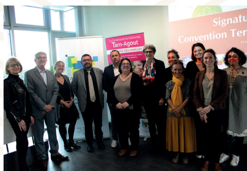
Signature de la nouvelle convention territoriale globale 2023-2026 avec la Caisse d'allocations familiales du Tarn