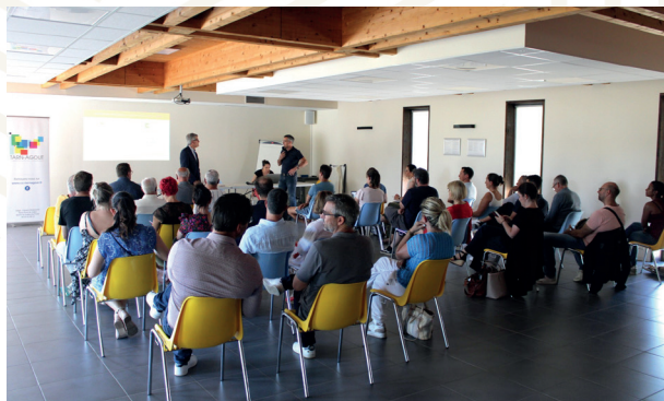
Rencontres des petites et moyennes entreprises en Tarn-Agout dans les locaux de la CITEL à Saint-Sulpice-la-Pointe