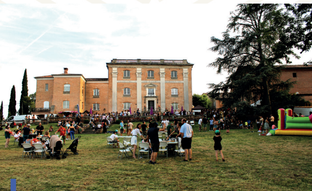
Soirées « Vendredi Es Aqui » à Azas le 16 juin, et Massac-Séran le vendredi 15 septembre