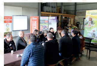
Rencontres professionnelles Agrilocal à Ambres