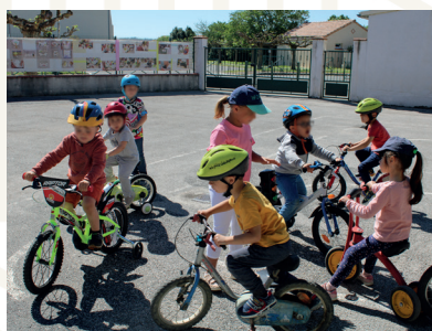
Enquête en ligne sur le schéma directeur vélo (480 contributions)